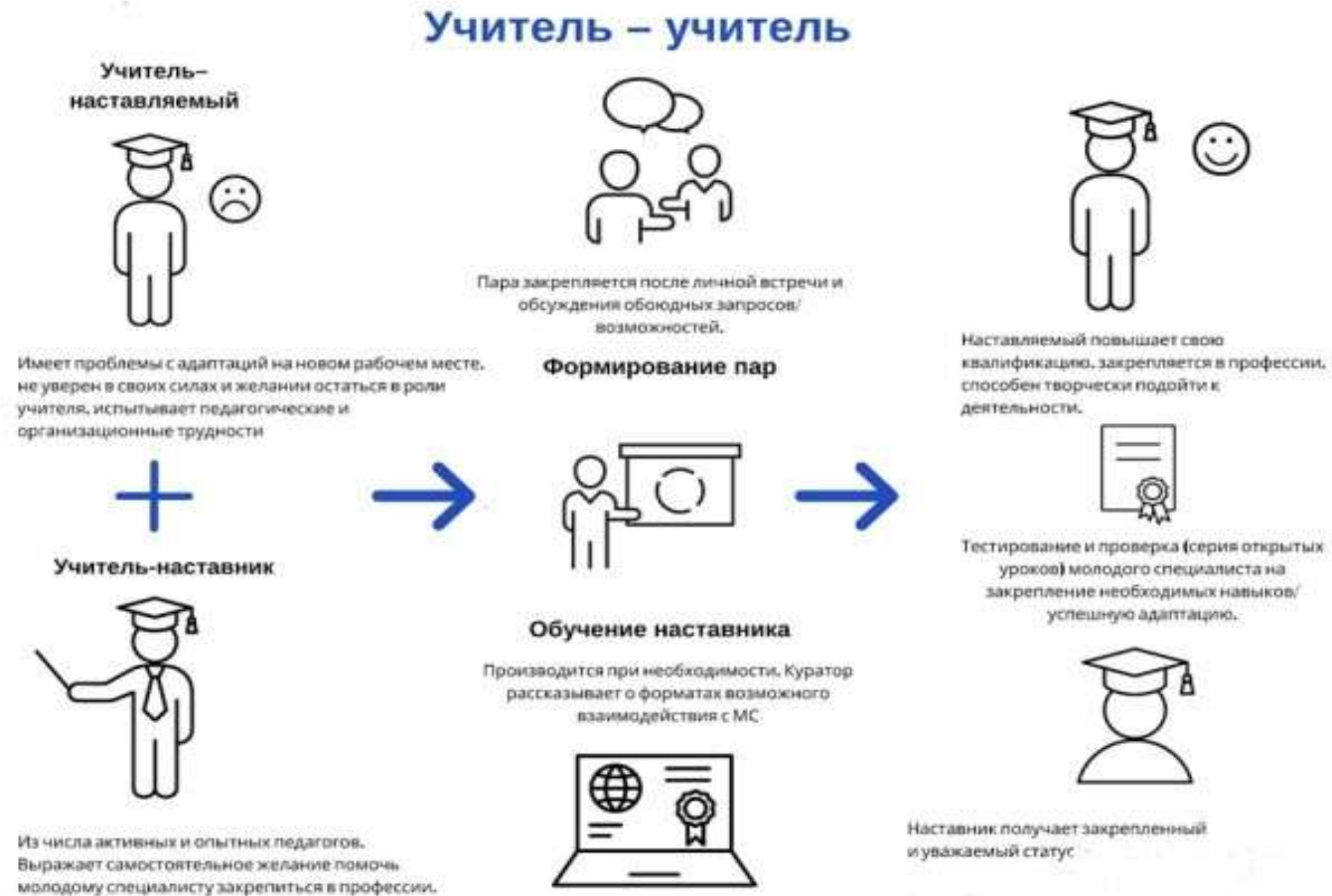
Рисунок 2. Графическое представление взаимодействия по форме «учитель – учитель»