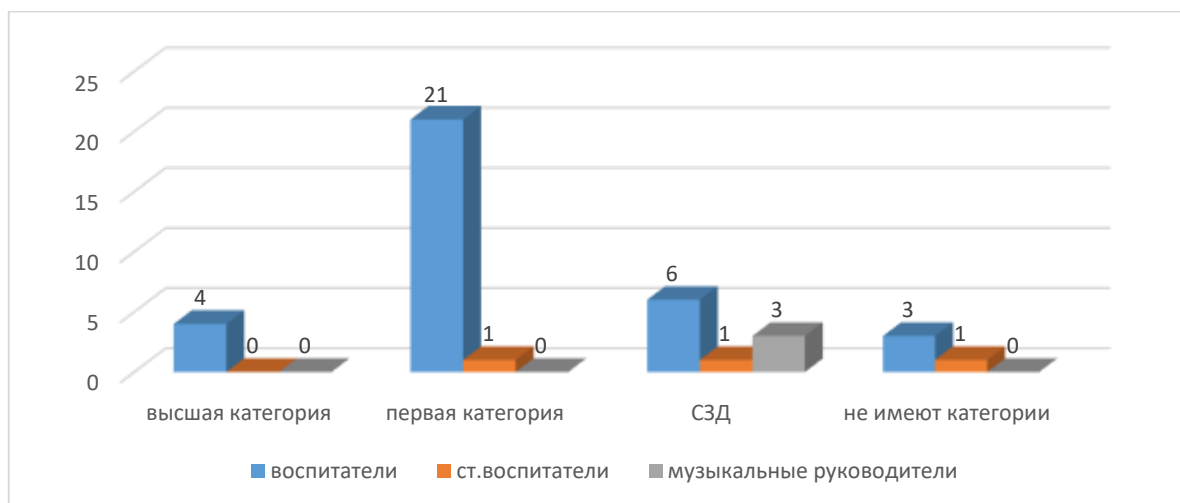
Рис.3. Распределение педагогических работников ДОО по уровню квалификации 100 % педагогических работников прошли в течение последних трех лет повышение квалификации и (или) профессиональную переподготовку. Таблица 3.